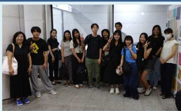
派遣高校生と保護者の皆様