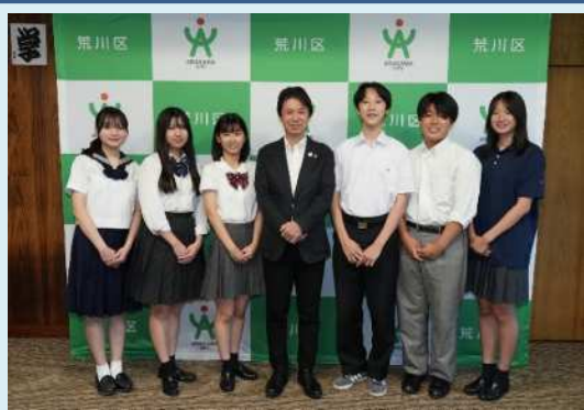
滝口区長と派遣高校生6名