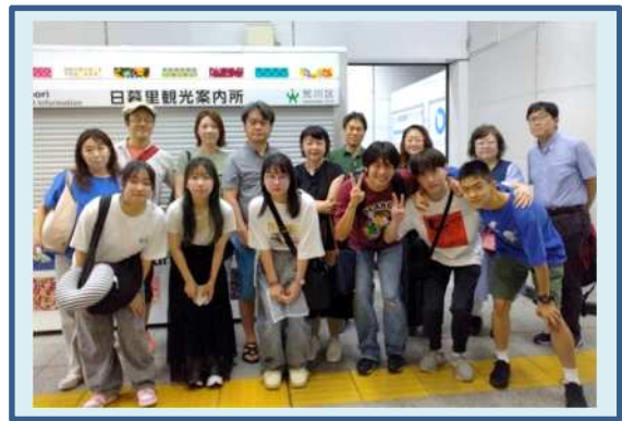
派遣高校生と保護者の皆様