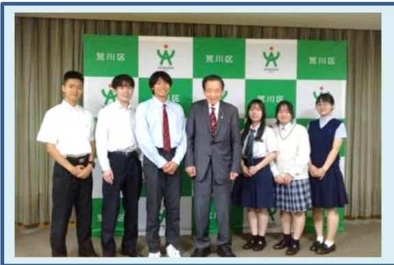
西川区長と派遣高校生6名