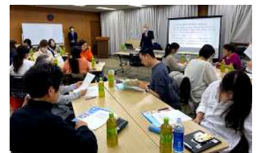
～グループワークの様子～

「コミュニティ通訳」とは何か、通訳をする上で意識をする事、行政で通訳をする場合のケースについて、講義いただきました。