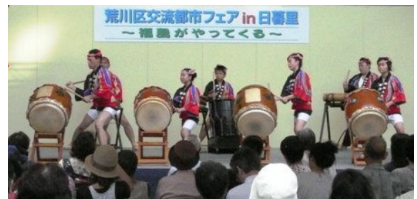
【昨年の交流都市フェア・ステージの様子】