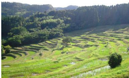
【田が階段のように連なる大山千枚田】