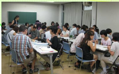
【 日本語教室 夜コース 】