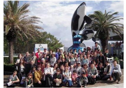
【鴨川シーワールドにて記念撮影】

帰りは東京湾アクアライン経由で東京湾に浮かぶパーキングエリア「海ほたる」に寄りました。天気が危ぶまれましたが、雨に降られることなく、1日たっぷりと楽しく過ごすことができました。