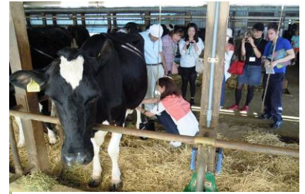
【カスヤファームで牛の乳しぼり体験】