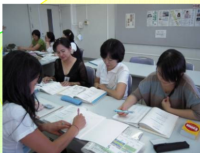
【 日本語教室 昼コース 】