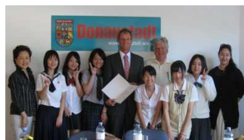
< 2013年度派遣生 >

なお、ドナウシュタット区との相互交流のため、派遣生のご家庭には、原則としてドナウシュタット区からの派遣生（8月13日～25日予定）のホストファミリーを引き受けていただきます。（やむをえない事情がある場合は、その限りではありません。事務局にご相談ください。）ホームステイでは、日本の家庭の普段の生活を体験してもらうため、「もてなし」は必要ありません。子ども部屋を一緒に使う等の工夫をしていただければ十分です。