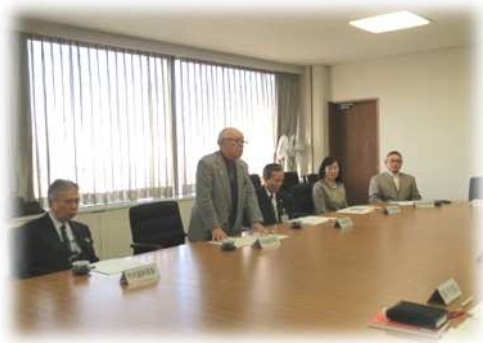
< 理事会の様子 >