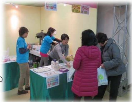
< 来場者の方に、国際交流協会をPRしました >

また、荒川区の海外友好交流都市の紹介として、ウィーンのチョコレートの販売も行いました。フェアトレードコーヒー、ウィーンのチョコレートとも大好評でした。