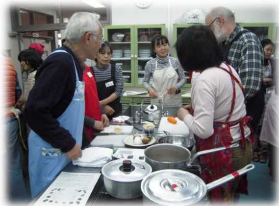
調理をしながら、日本語も学びます

受講生の方々は料理を作りながら、「野菜を切る」、「具材を煮る」など生活の中で使う日本語を、ボランティアの皆様と確認しながら調理していました。