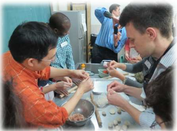
グループ毎に小籠包の包み方を体験しました

参加者の方々からは、「日本の料理は少し作りますが、ちらし寿司という料理は初めて知りました。」といった感想をいただきました。