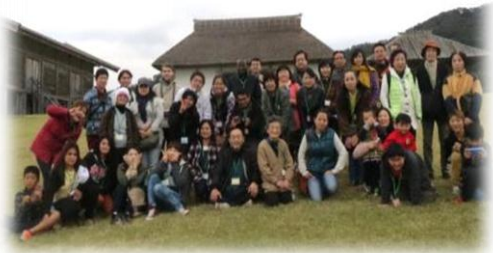
【遺跡前で記念撮影】