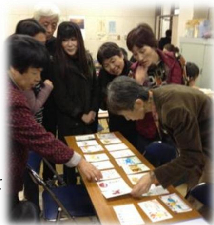
【完成した作品を並べて 年賀状コンテスト】

まず、ボランティアの方から宛名の書き方や、年始の挨拶等について説明を受けた後、年賀状を作りました。来年の干支「午」を描いたり、絵を切り抜いて貼り付けたり、それぞれ工夫を凝らした年賀状が出来上がりました。受講生の方は、「ボランティアの先生に年賀状を送りたい。」と、宛名の書き方を練習していました。