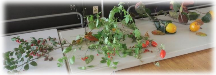
【入口には柿やからすうり等、秋の草花が飾られていました】