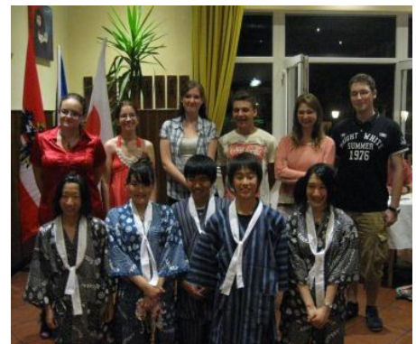
< 2012年度派遣生 >