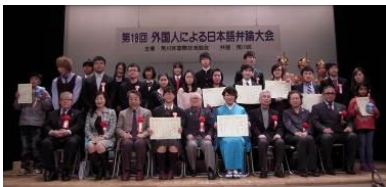
〈発表者、審査員、アトラクション出演者 集合写真〉

表彰式では優勝、準優勝、ロータリークラブ賞、ライオンズクラブ賞、審査員特別賞、荒川区国際交流協会賞の受賞者が発表され、国際交流協会の理事からそれぞれの賞状と賞品が授与されました。また、特別参加をした小学生2名に、特別賞が贈られました。