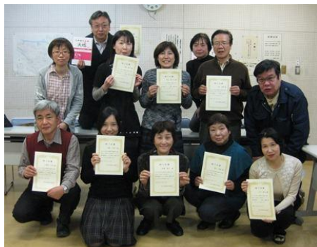
【夜コース 受講生の皆様】

今後は「外国人のための日本語教室」や「日本語サロン」の日本語ボランティアとしての活躍が期待されています。