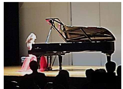
ミサクさんが奏でる音に合わせ、リズムをとる人もいました。

来年2019年は日澳修好150周年。国内外で様々な記念行事が予定されており、両国の交流はますます盛り上がることでしょう。ご来場の皆様並びにリサイタル開催にあたりまして、協賛・ご協力頂きました皆様に、改めて御礼申し上げます。ありがとうございました。