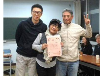
受賞された学習者さん、先生と一緒に記念撮影