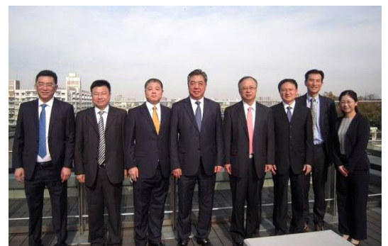
ゆいの森のテラスにて記念撮影をする一行