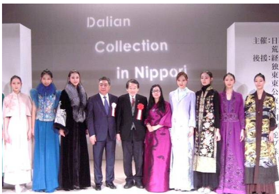
モデル芸術学校の学生たちとの記念撮影

初来日の曲区長でしたが、路上のごみが少ないことや日本人の礼儀正しさに感心されていました。また、「両区の交流がより盛んになるように、新たな企画を考えていきたい。」とのことでした。