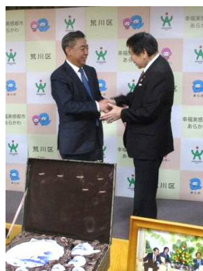
力強い握手を交わす両区長